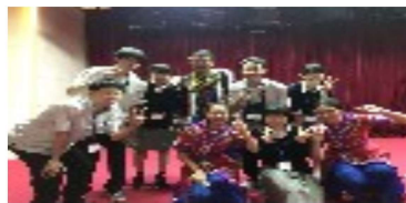
▲中国の学生さんたち

*wechatで中国の学生の謎変換によるおかしな返事 「あんたは？」「ハハ、いい午後」 「そこは面白いところではない」「それは我らの国宝だ」 *食卓に水が出ない（コーラとスプライト） *結論・日本の中華は嘘く中華であって中華でない